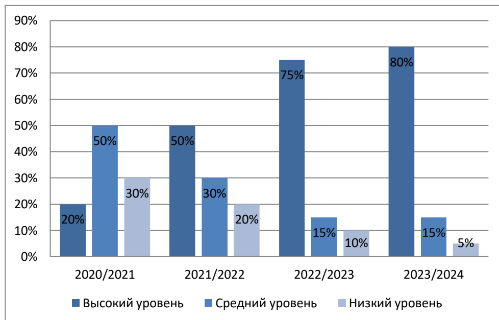
Диаграмма 2 Мотивация обучающихся

Одним из параметров, определяющих уровень освоения программы, является отношение обучающихся к учебному процессу. Представленные данные свидетельствуют о высокой мотивации обучающихся к занятиям.